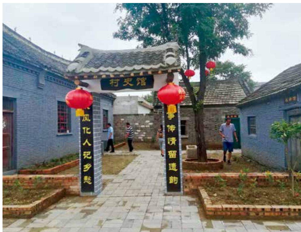
村民在宝丰县闹店镇东五龙庙村村史馆参观展览