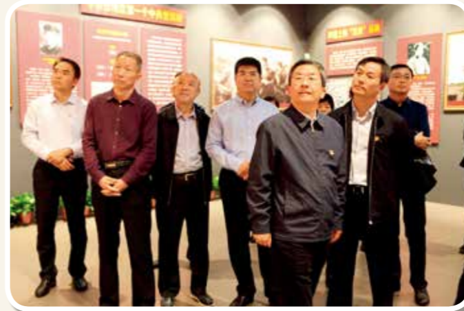
2019年10月8日，市长张雷明，市委常委、常务副市长摆向阳，副市长张弓、王朴、刘文海、刘颖、张庆一，市政府秘书长赵军等到市博物馆参观“红色印记”——平顶山革命历史展