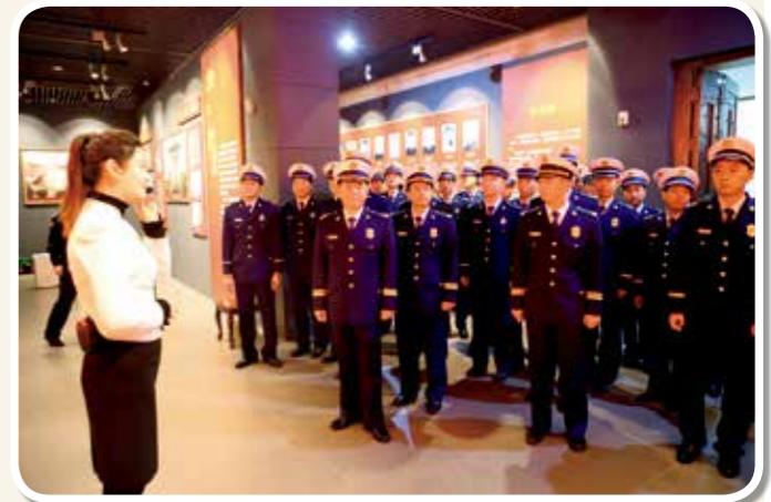
2019年10月16日，平顶山市消防支队消防官兵参观展览