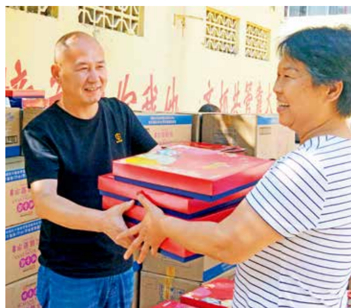
新华区曙光街街道李庄村工作人员将中秋福利送到村民手中