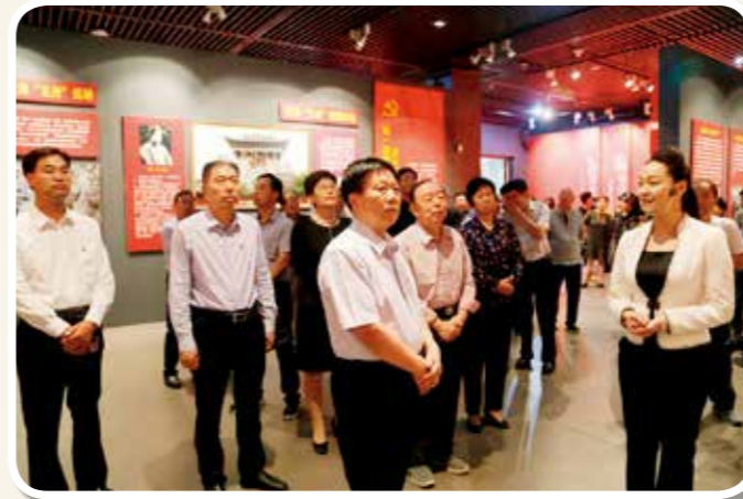
2019年9月30日，市委书记周斌，市委副书记葛巧红，市人大常委会主任李萍，市政协主席黄庚侗，市委常委、组织部长张明新，市委常委、秘书长杨克俊在市老促会会长裴建中等陪同下到市博物馆参观“红色印记”——平顶山革命历史展