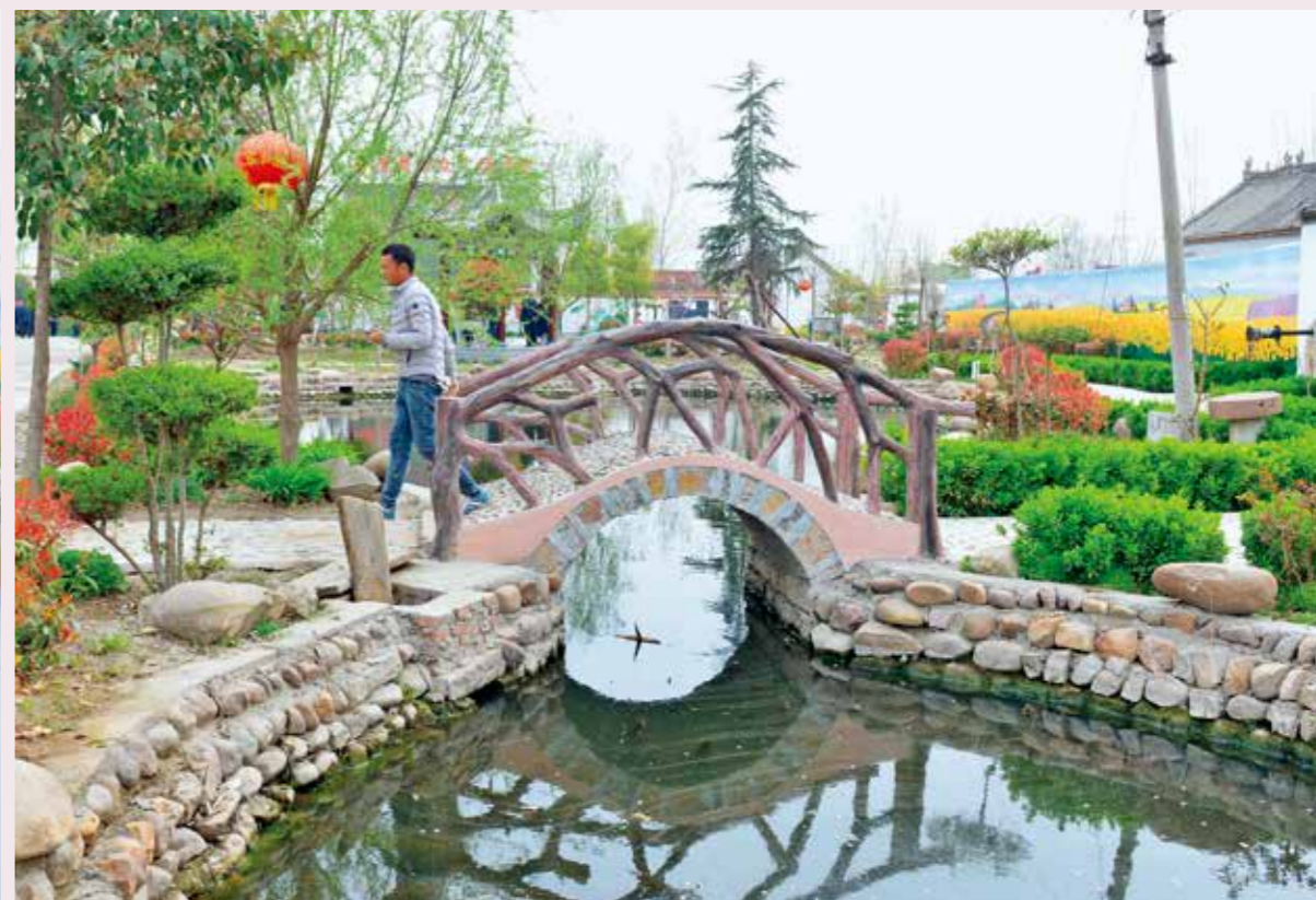
宝丰县张八桥镇王堂村村民在景色怡人的文化广场上休闲娱乐