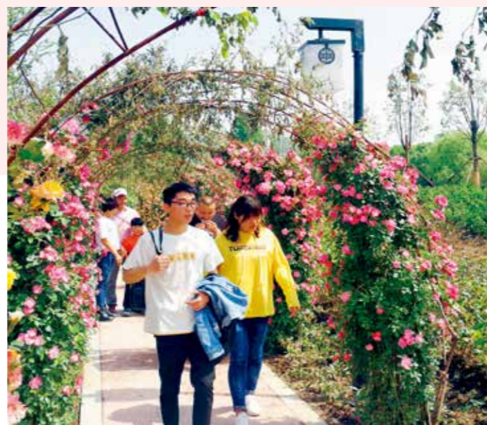
游客在秀林园踏青赏景