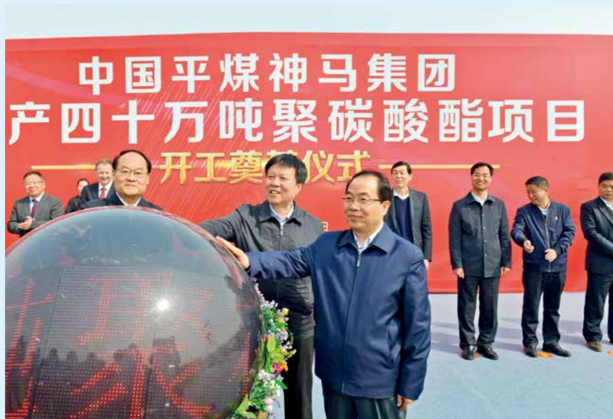
2019年3月24日，中国平煤神马集团年产四十万吨聚碳酸酯项目开工