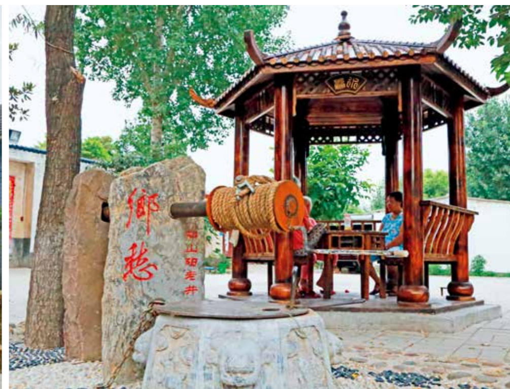
村民们在新华区焦店镇郑山阳村古井旁的凉亭内纳凉