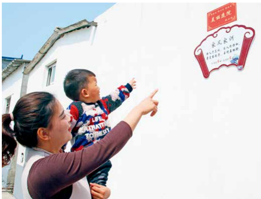
村民带着孩子在城乡一体化示范区应滨街道花山村欣赏自家门前的“美丽庭院”奖牌