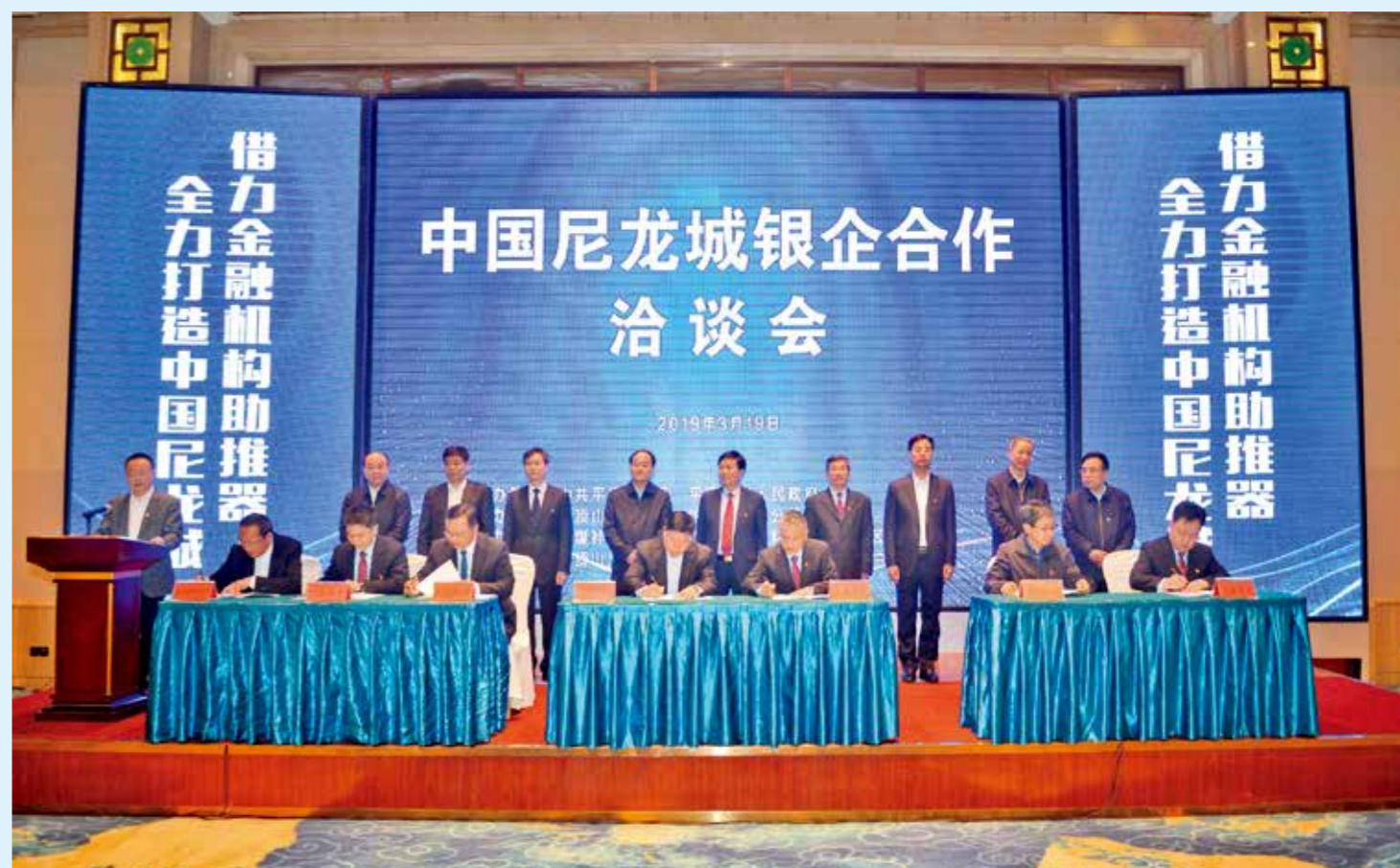
2019年3月19日，中国尼龙城银企合作洽谈会签约仪式