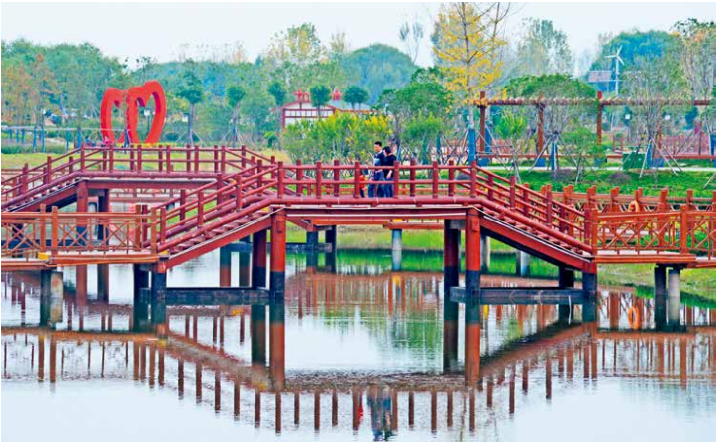
初冬时节的城乡一体化示范区湿地公园鹭栖湾景色宜人