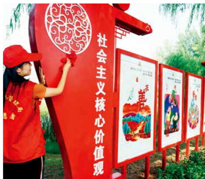
志愿者在白鹭洲国家湿地公园擦拭社会主义核心价值观宣传栏