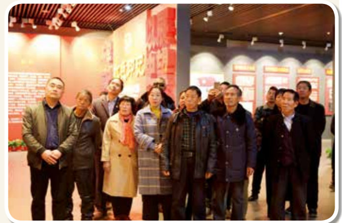
2019年11月20日，鲁山县董周乡群虎岭村党员群众参观展览