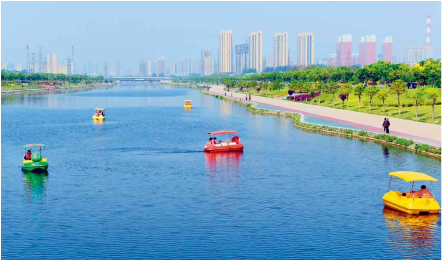
治理一新的湛河两岸碧水如蓝