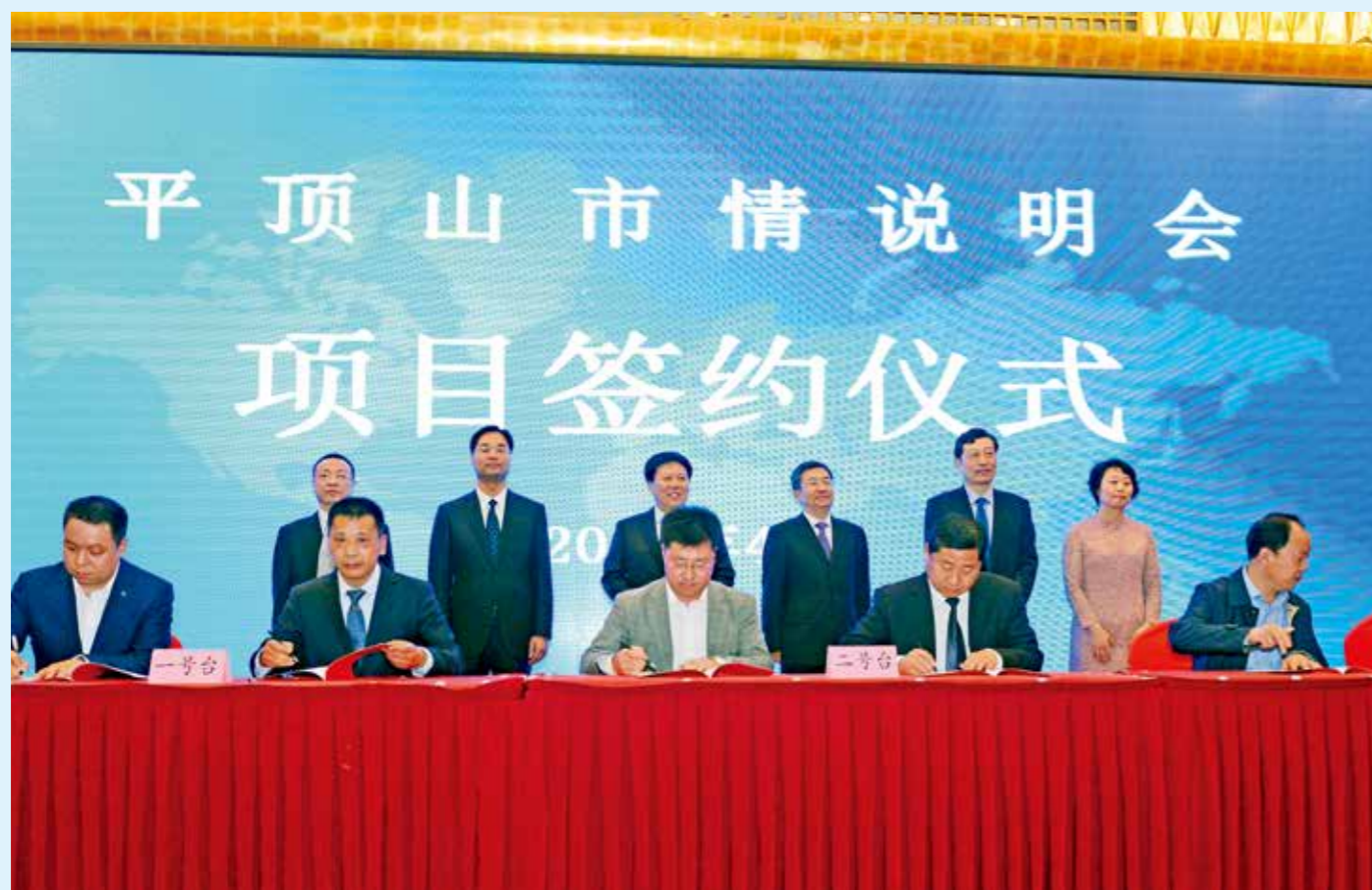
2019年4月8日，第十三届中国（河南）国际投资贸易洽谈会平顶山市情说明会暨项目签约仪式