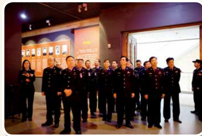
2019年11月20日，湛河区北渡派出所公安干警参观展览