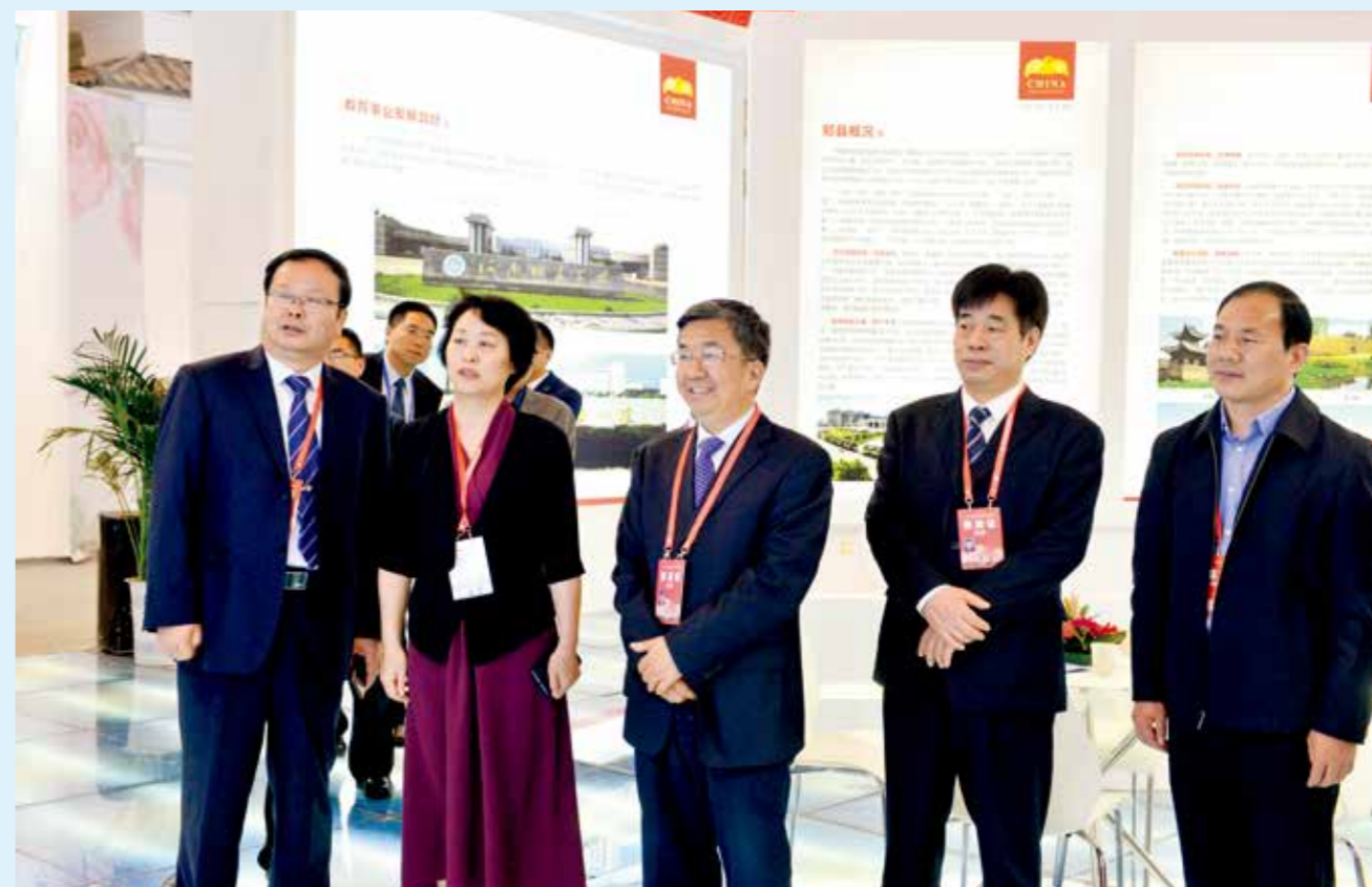
2019年4月8日，第十三届中国（河南）国际投资贸易洽谈会