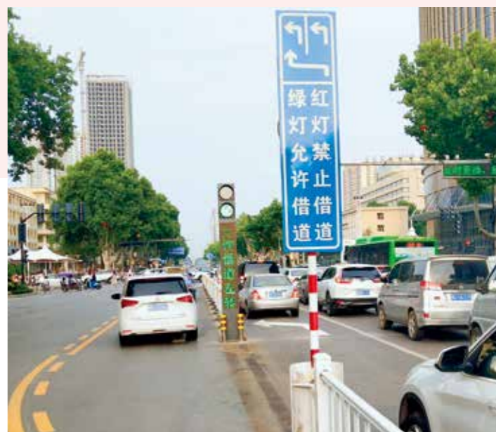
市区部分道路实行借道左转疏导车流量