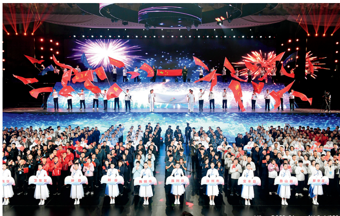
平顶山市第十一届运动会暨第六届全民健身大会

举办平顶山市第十一届运动会暨第六届全民健身大会。开展“最美大课间”“一校一品”评选活动。组织“市长杯”青少年校园足球联赛；举办10项“奔跑吧·少年”系列市级青少年比赛；开展各类全民健身活动310余项，带动7.7万余人参与。全年在省级及以上比赛获得100金、127银、146铜共373枚奖牌。平顶山市籍赛艇、跆拳道、冲浪、武术等项目运动员代表河南参加全国比赛，取得3金3银3铜共9枚奖牌。平顶