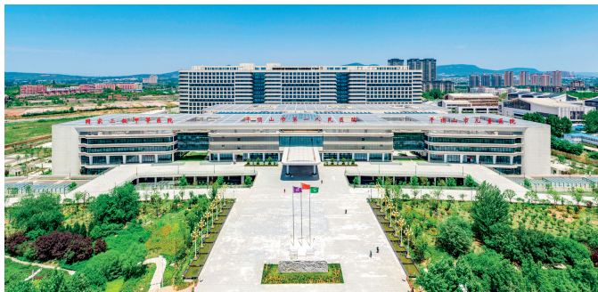
平顶山市第一人民医院

体。全市新开工保障性租赁住房项目4151套；发放人才购房补贴134人483.5万元，为各类人才分配公租房249套；新分配公租房743套。