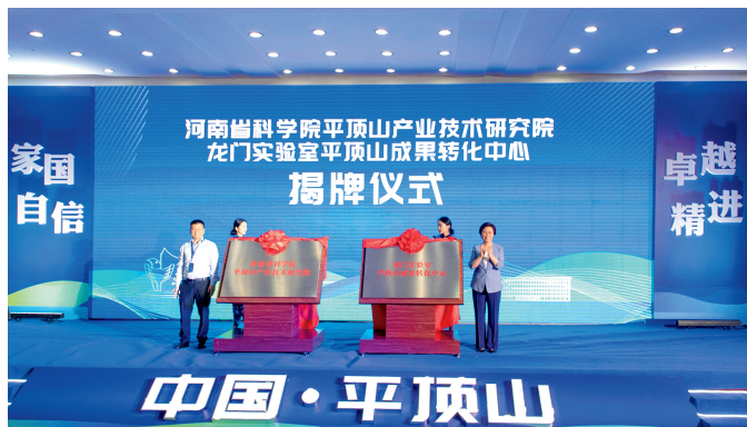
河南省科学院平顶山产业技术研究院和龙门实验室平顶山成果转化中心揭牌成立

年末有省级以上企业技术中心 54 个，其中国家级 3 个；省级以上工程研究中心 24 个。省级工程技术研究中心 132 个。省级重点实验室 6 个，国家级重点实验室 1 个。启动实施 2 个省重大科技专项。获得省级科学技术奖 6 项。全年授权专利 3441 件。截至 2023 年底，