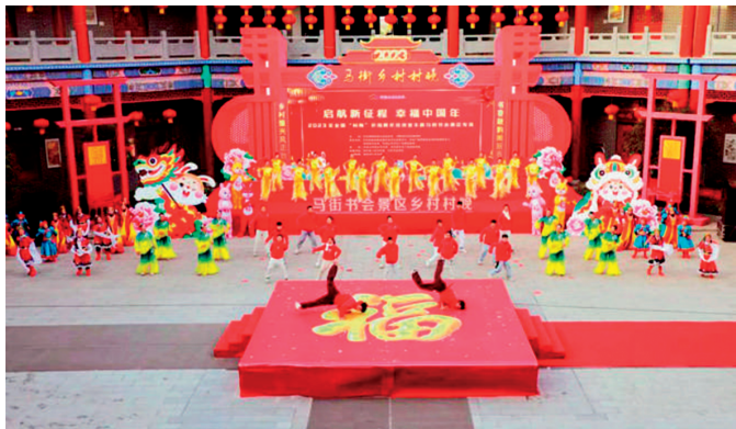
2023年宝丰马街书会乡村“村晚”在马街景区现场录制

马街书会景区乡村“村晚”，网络直播观看人数达220万，各大平台点击浏览量达500万。宝丰县清凉寺村被列入全国夏季“村晚”示范展示点。