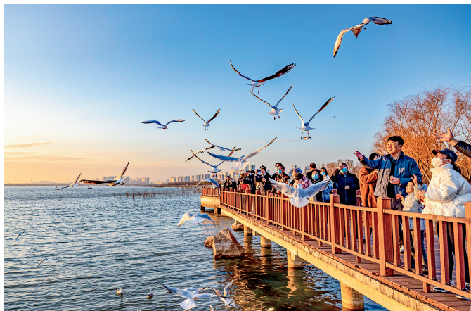
红嘴鸥吸引着大量游客前来打卡观赏

全市PM10、PM2.5平均浓度分别为80微克/立方米、44微克/立方米，同比分别下降8微克/立方米、4微克/立方米，优良天数250天，同比增加7天，空气