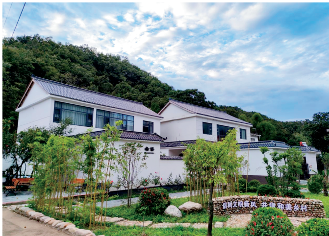
鲁山县尧山镇上坪村党支部领办乡村民宿

深化农村集体产权制度改革。实现“资源变资产、资金变股金、农民变股东”“三变”改革，全市