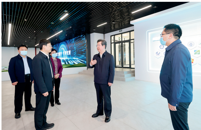
市委书记陈向平陪同省委书记楼阳生调研尧山实验室

校、市卫健委等单位招聘引进硕士研究生 105 人。组织开展“2023 年平顶山市优秀硕博人才专项招引行动”，分赴北大、清华等国内 16 所知名高校，为尧山实验室、国有企业和市直事业单位招引一批全日制博士、硕士研究生。实施在外人才“归根”工程。“归根”工程项目库新增项目 219 个，投资金额 649.01 亿元。平顶山市高新火炬园孵化器获评国家级科技企业孵化器，平顶山学院等 3 家单位入选省技术转移示范机构，新增