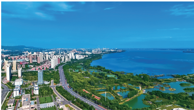
白龟湖畔水清岸美，翠色欲滴

截至2024年底，全市林木覆盖率35.3%，境内有国家级自然保护区1个（河南伏牛山国家级自然保护区〔鲁山县〕）、国家级森林公园2个（汝州国家级森林公园、舞钢石漫滩国家级森林公园）、国家级湿地公园3个（白龟湖国家湿地公园、舞钢石漫滩国家湿地公