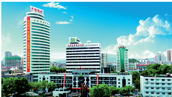
中国平煤神马控股集团有限公司

元。河南平芝高压开关有限公司、平煤神马机械装备集团河南矿机有限公司获国家级专精特新“小巨人”称号；河南平芝高压开关有限公司、河南平高通用电气有限公司等企业纳入2024年省级制造业单项冠军企业名单。“新型电力（特高压输变电）装备产业集群”成功入选省级先进制造业集群；平顶山平煤机煤矿机械装备有限公司的产品通过“2024年河南省首台（套）重大技术装备”认定，河南平高电气入选国家级卓越级智能工厂。